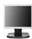
LCD monitor 17"