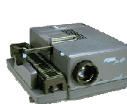
FOMEI AFS-250 IR