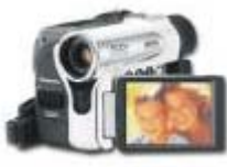
NV- GS 40