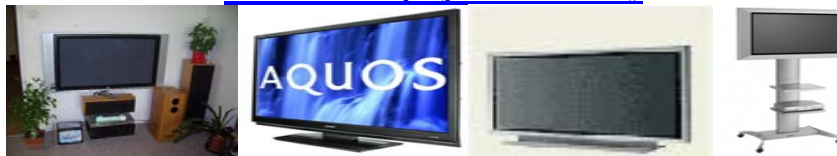
LG RZ- 42 PX 11 LG 42PX4R-ZA PANASONIC TH-50PHW6 Stojan na LCD/ plasmu Vogel PFT2100