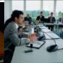
Ukázky z konferencí