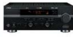
Zesilovač YAMAHA 550