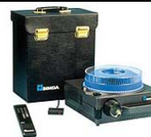
SIMDA 400 W