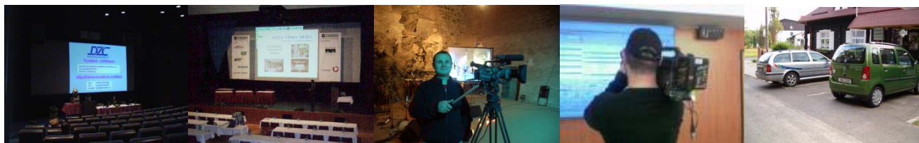
Konference FORUM MÉDIA