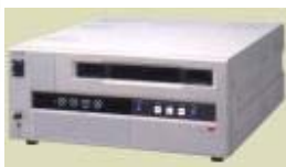
BETACAM - VIDEO