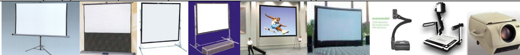
STATIVOVÉ PLÁTNO Movielux Compa RÁMOVÉ PLÁTNO 240x 180 cm/ 400x 300cm/ 600x 400cm 730x 550cm