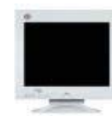
CRT monitor 19"