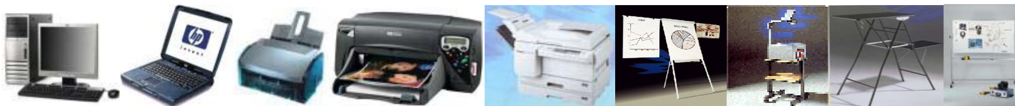
PC HP dx 7100