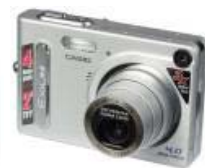
CASIO EXILIM EX- 4