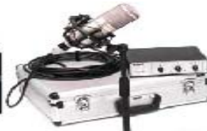
Sady mikrofon + mix pultík