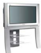
TX 29 AS 10